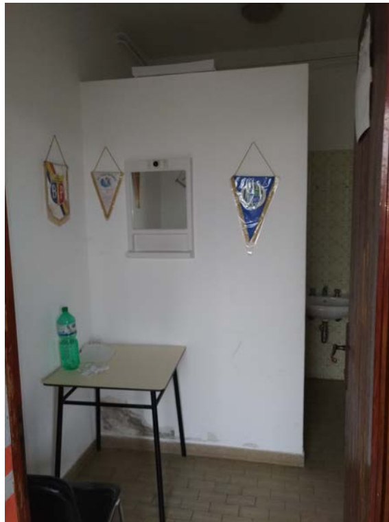
Foto17 – Interno spogliatoio arbitri