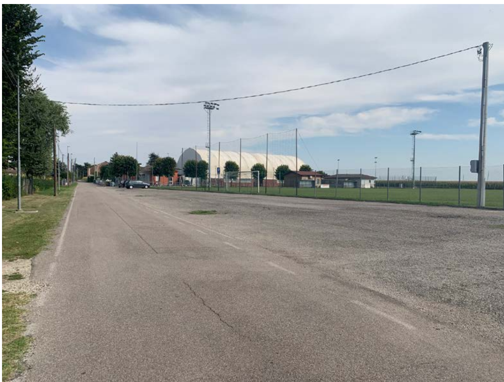
Foto1 – Parcheggio degli impianti sportivi