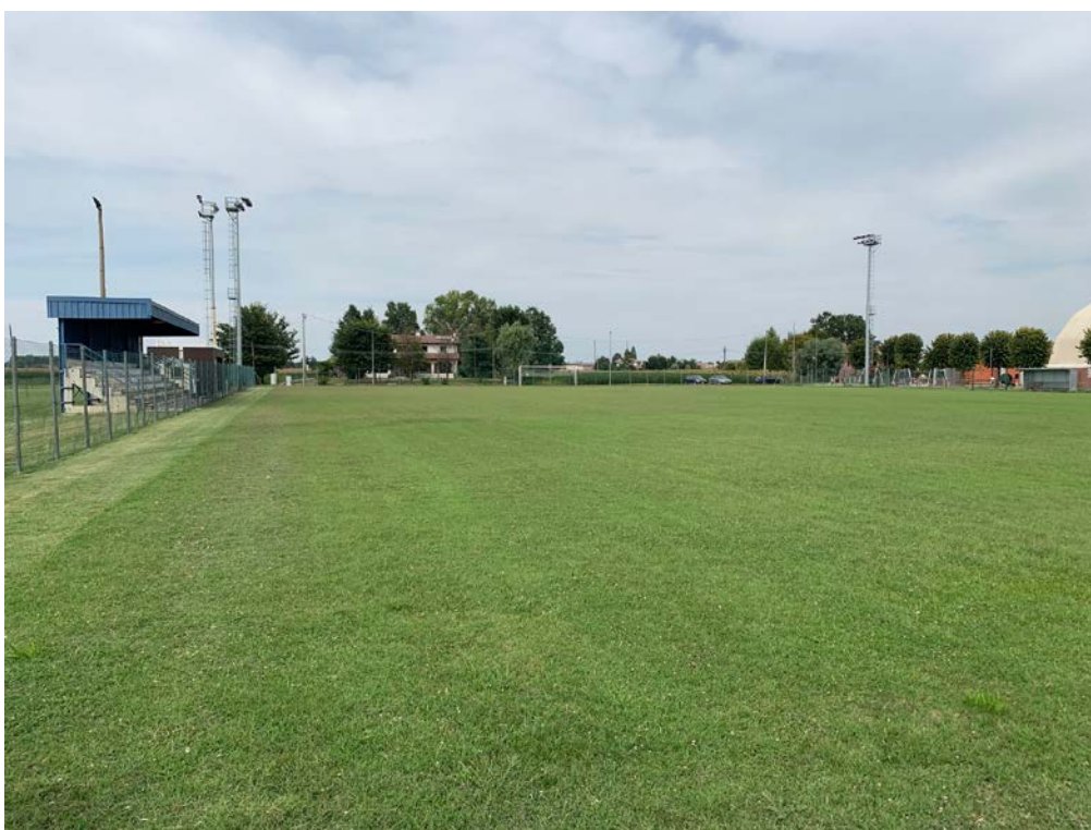
Foto3 – Campo da calcio