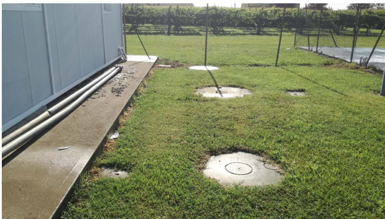
Foto 22- Vasche di raccolta dei reflui provenienti dai bagni e dalle docce