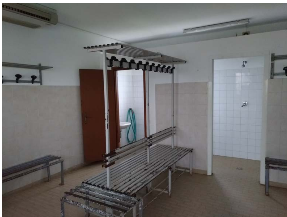
Foto16 – Interno spogliatoio atleti