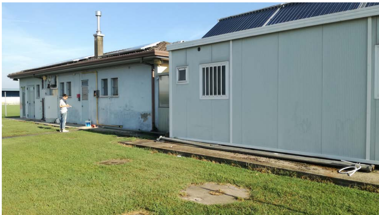
Foto 21- Vasche di raccolta dei reflui provenienti dai bagni e dalle docce in corrispondenza del prospetto sud degli spogliatoi