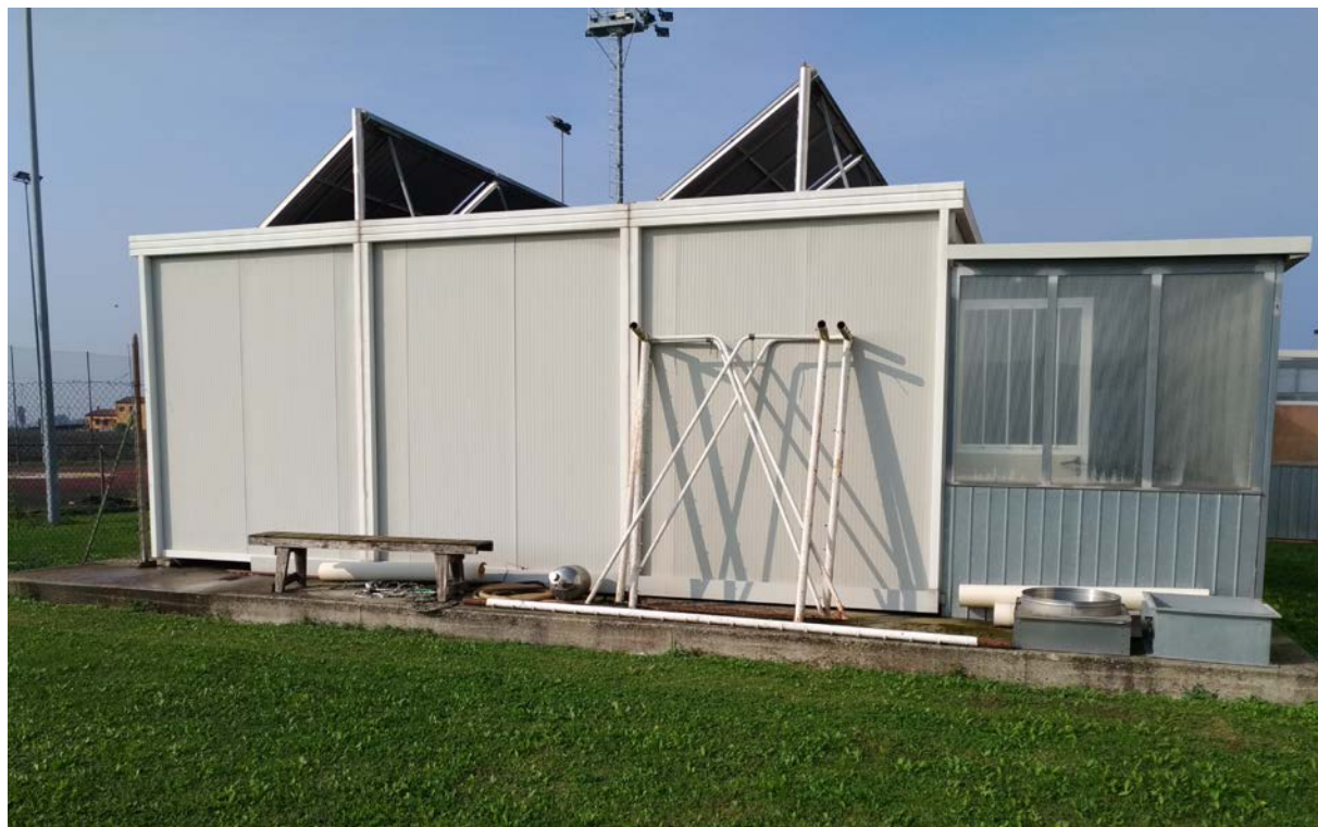
Foto15 – Edificio spogliatoi esistente, prospetto est