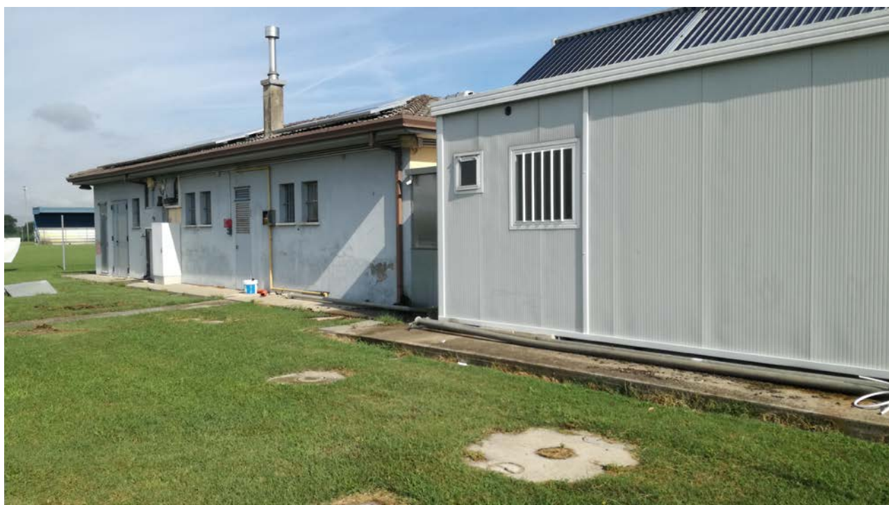
Foto 20 –Edificio spogliatoi esistente, prospetto sud dove sono collocate le vasche di raccolta dei reflui provenienti dai bagni e dalle docce