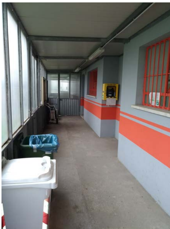
Foto19 – Tunnel di collegamento tra spogliatoi e tensostruttura