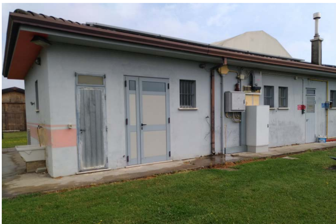
Foto12 – Edificio spogliatoi esistente, prospetto sud