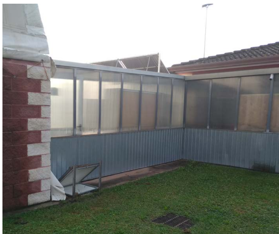
Foto10 – Tunnel di collegamento tra spogliatoi e tensostruttura