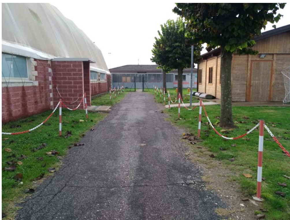
Foto7 – Vialeto di accesso agli spogliatoi