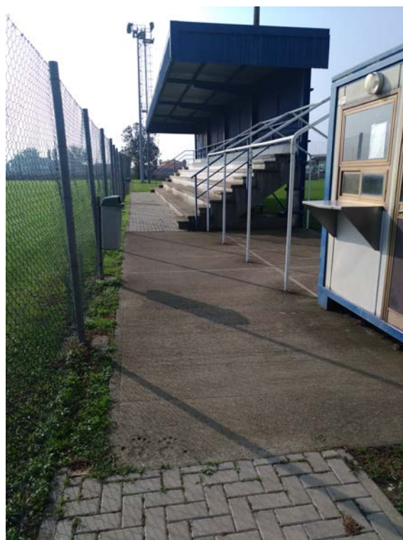
Foto4 – Tribune e area spettatori