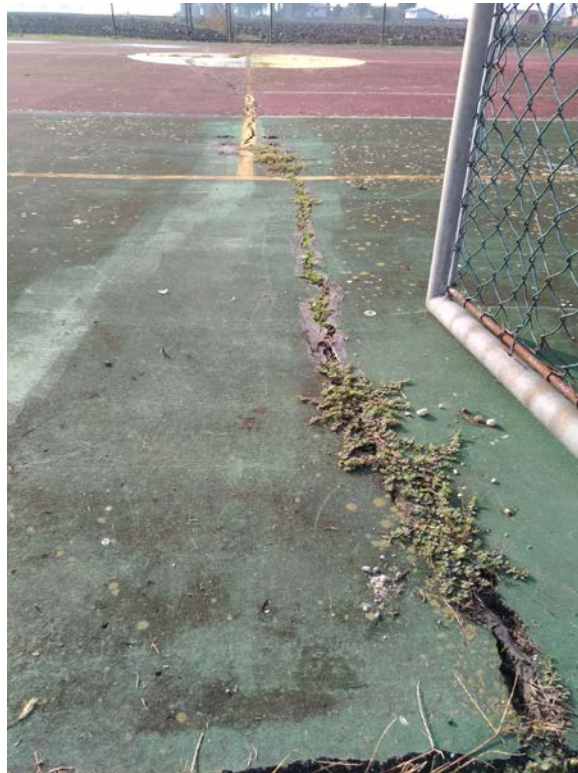
Foto5 – Campo da tennis inutilizzato