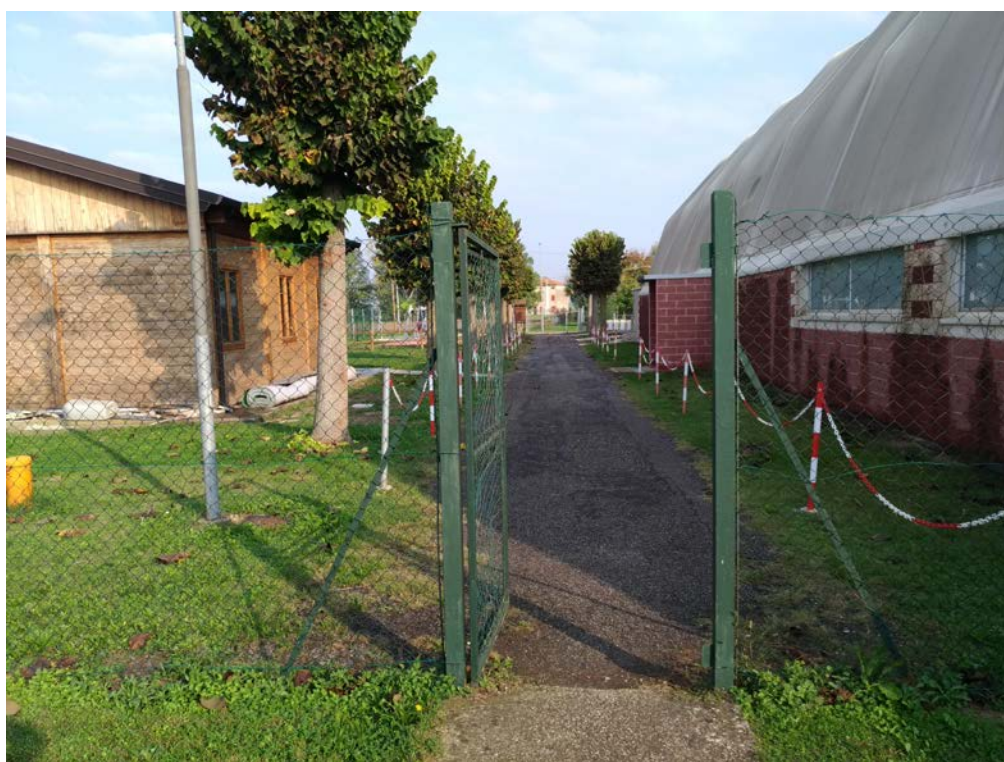
Foto8 – Accesso pedonale agli spogliatoi