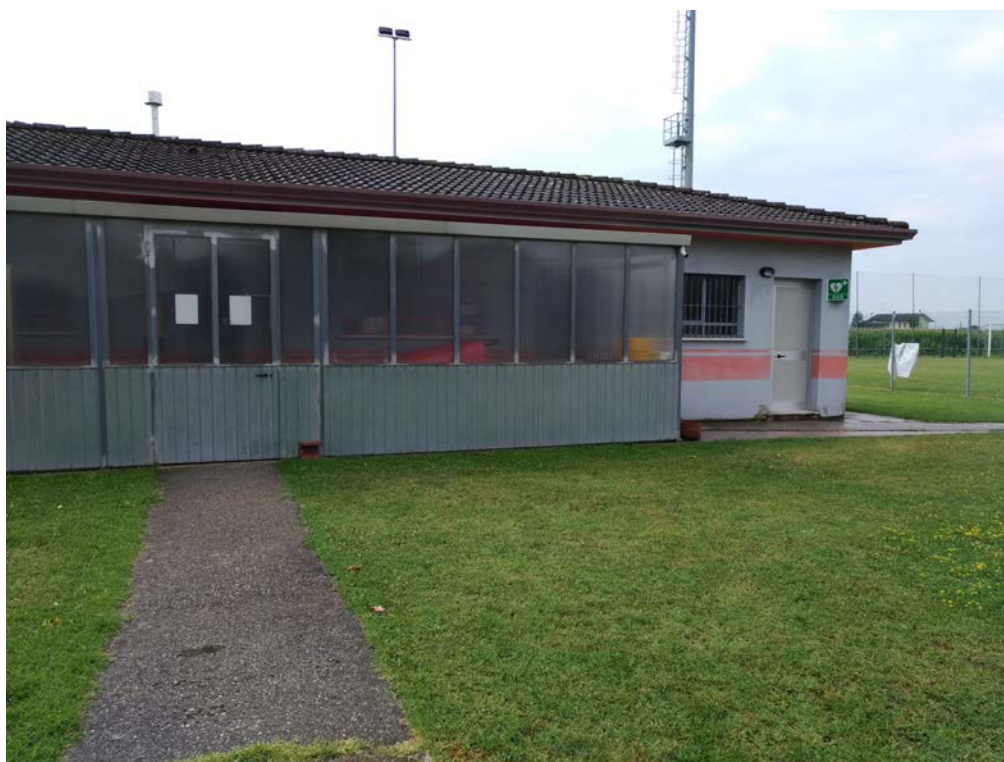
Foto9 – Edificio spogliatoi esistente, prospetto nord