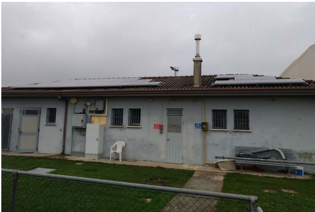
Foto13 – Edificio spogliatoi esistente, prospetto sud