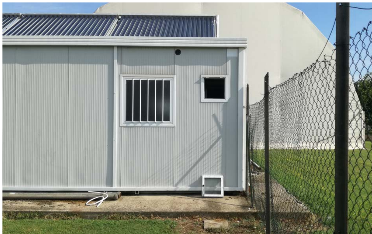
Foto14 – Edificio spogliatoi esistente, prospetto sud dove sono collocate le vasche di raccolta dei reflui provenienti dai bagni e dalle docce