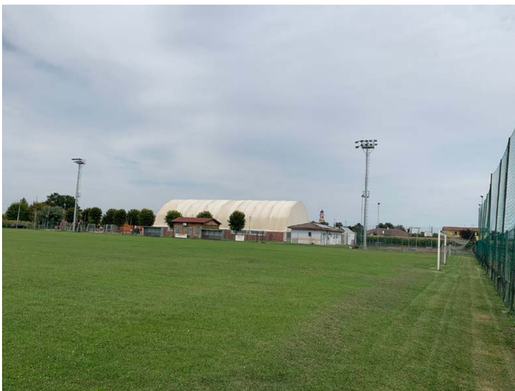
Foto2 – Campo da calcio