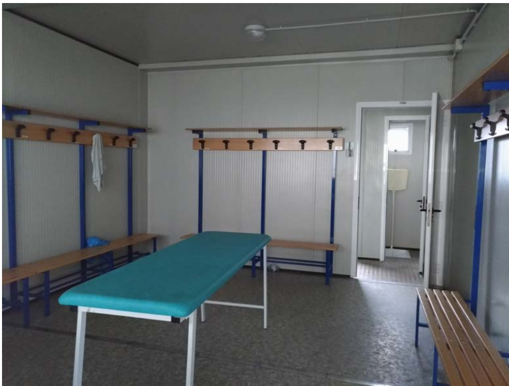
Foto18 – Interno spogliatoio atleti