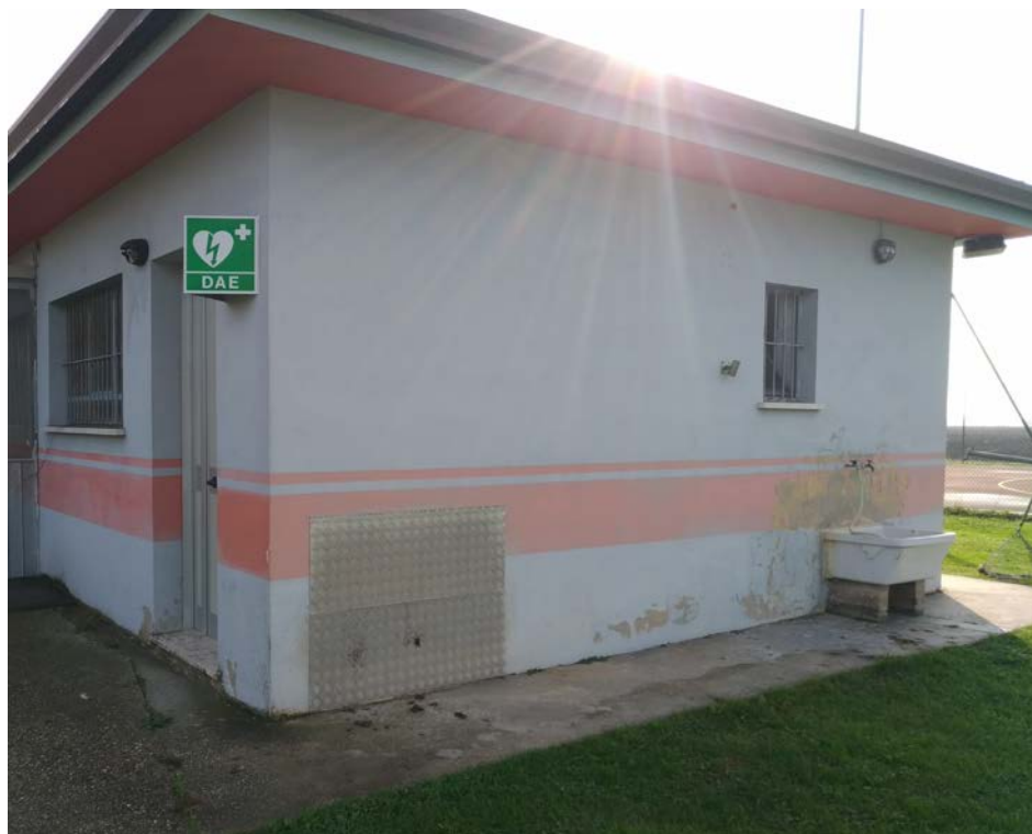
Foto11 – Edificio spogliatoi esistente, prospetto ovest