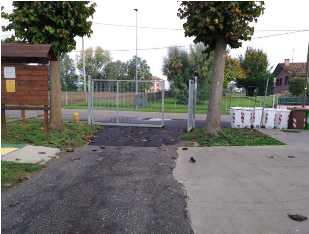
Foto6 – Accesso carraio agli impianti sportivi