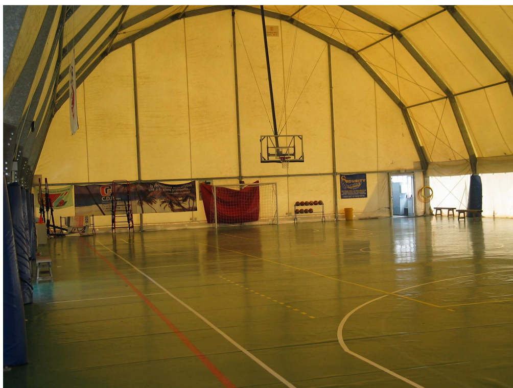
Foto. 4 Vista interna palestra