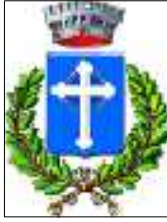
Comune di Bagnolo di Po