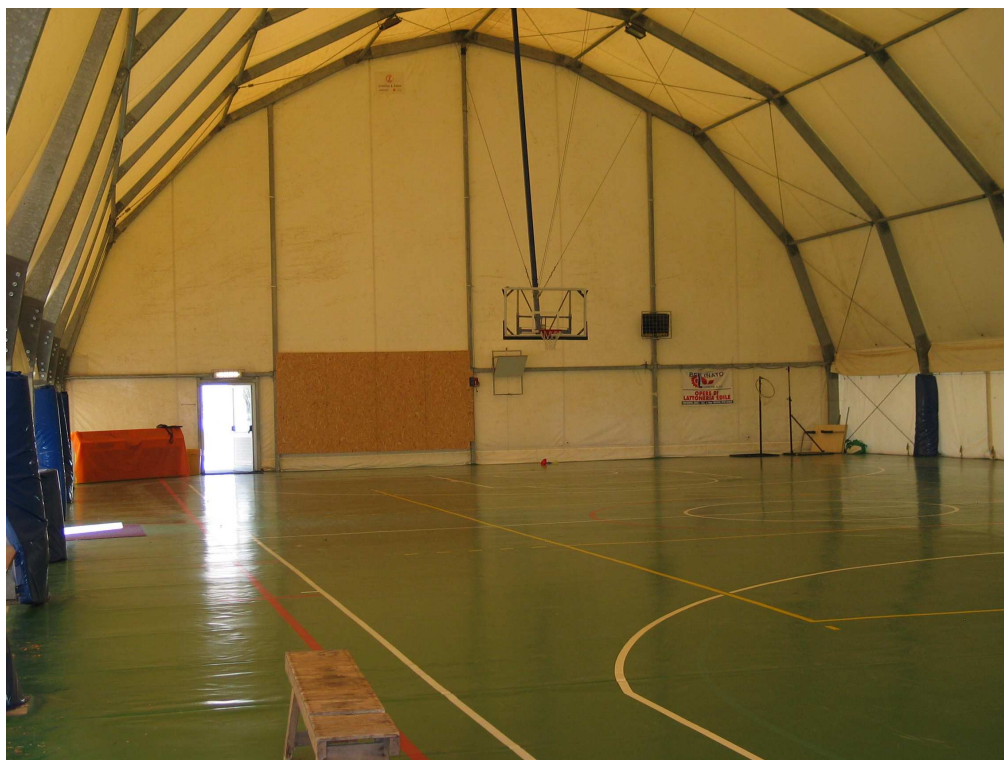
Foto. 5 Vista interna palestra