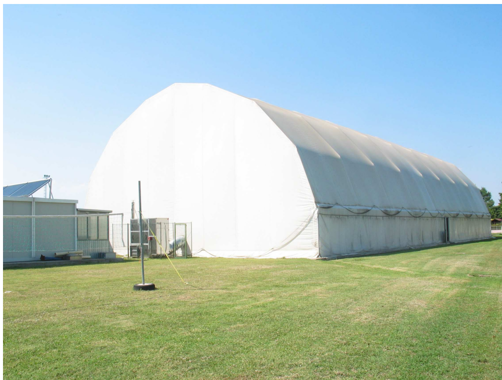
Foto. 3 Prospetti Sud ed Est