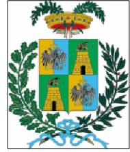
Provincia di Rovigo