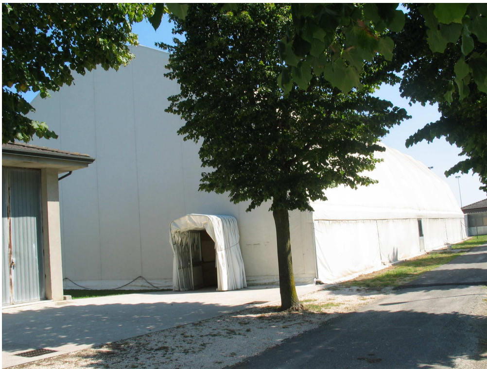
Foto. 1 Prospetti Nord ed Ovest