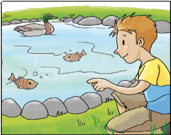
INTRODUCI I PESCI IN VASCHE E FONTANE.