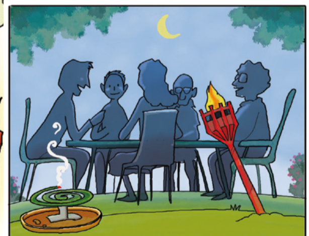
QUANDO SOGGIORNI ALL'APERTO, PROTEGGITI CON REPELLENTI AMBIENTALI. (*)