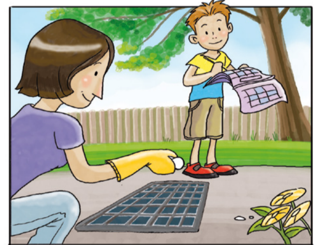
RICORDATI DI TRATTARE I TOMBINI CON PASTIGLIE DI INSETTICIDA, NEL PERIODO DA APRILE A SETTEMBRE. (*)