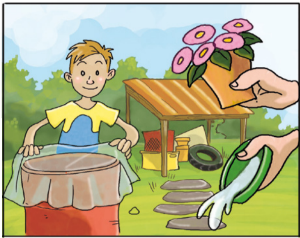
METTI AL RIPARO DALLA PIOGGIA TUTTO CIÒ CHE PUÒ RACCOGLIERE ACQUA.

Spesso l'insetticida non basta, ma ci sono molti altri modi per fermare le zanzare.